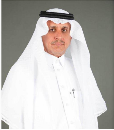
المشرف العام على الشؤون الإدارية والمالية